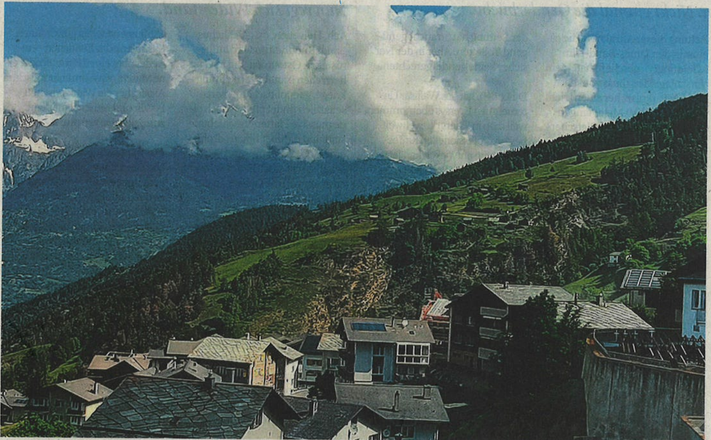
Vischpärtäärbinu, schees Doorf!